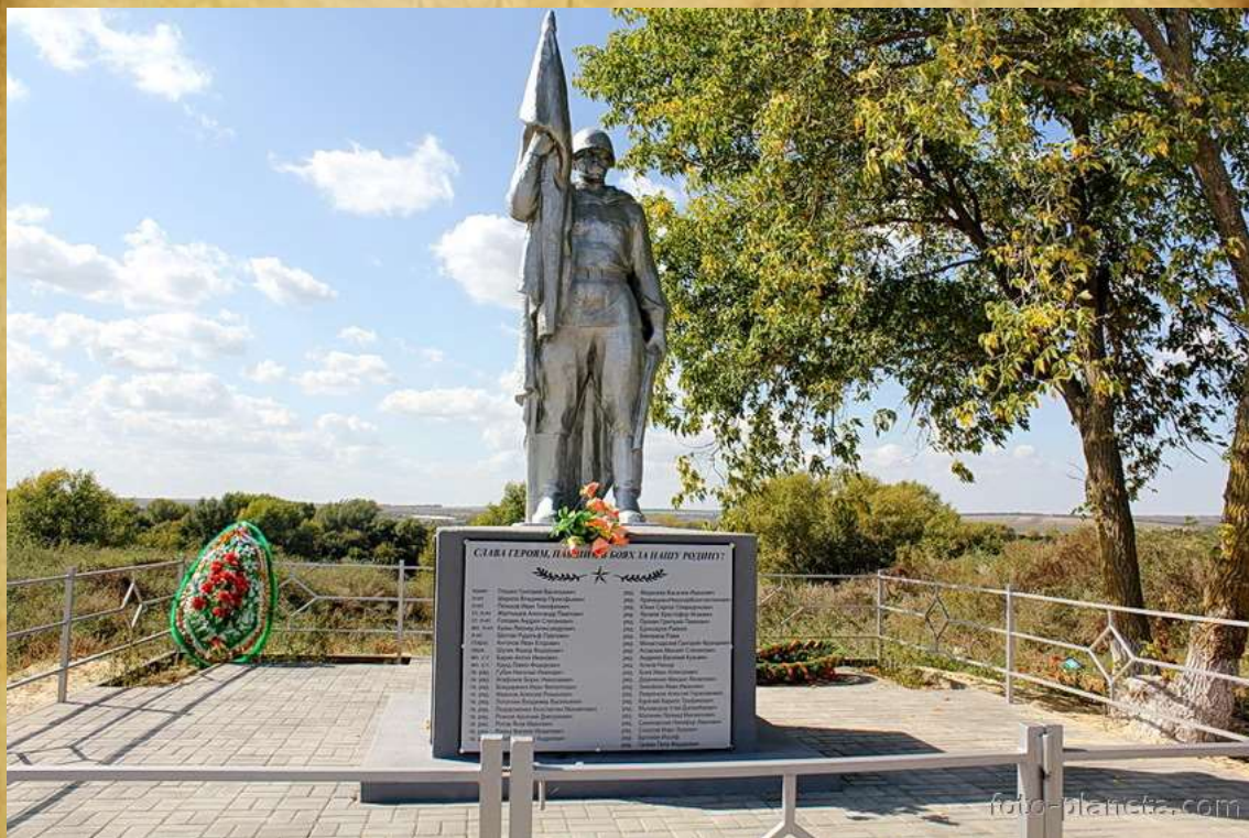
х. Красный Яр Ростовская область