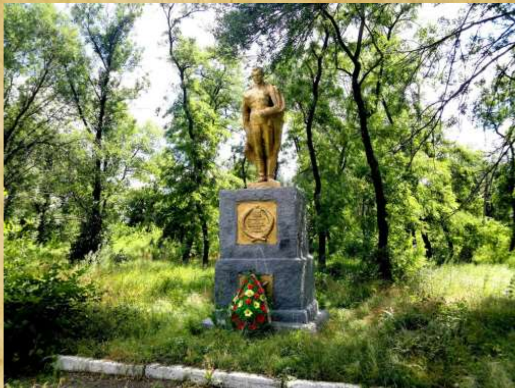
г. Шахты Ростовская область