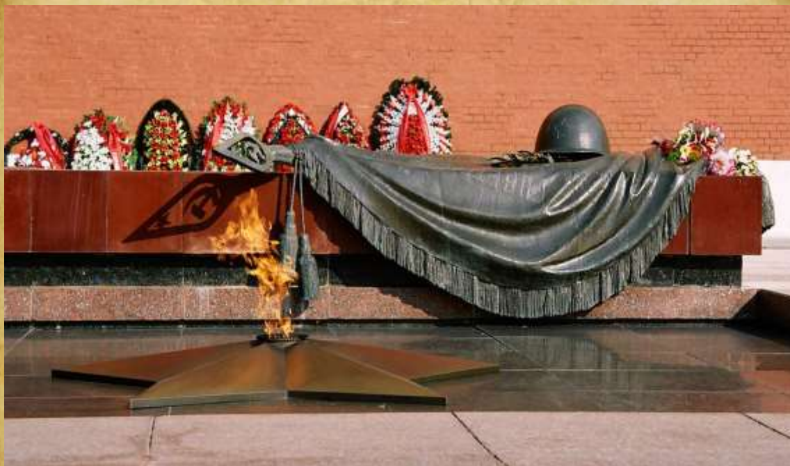
Могила Неизвестного Солдата г. Москва